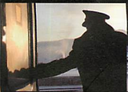
Illustration by 上国科 勇