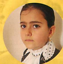
ルナーヒー (8 歳)