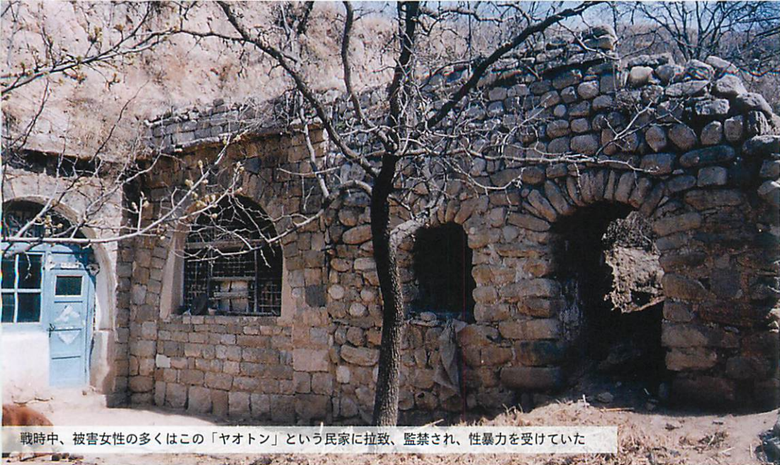
戦時中、被害女性の多くはこの「ヤオトン」という民家に拉致、監禁され、性暴力を受けていた

750人の支援者と共に作り上げた インディペンデント映画が海外映画祭で最高賞を受賞！ 日本での凱旋上映が急遽決定！