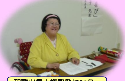
和歌山県人権啓発センター登録講師