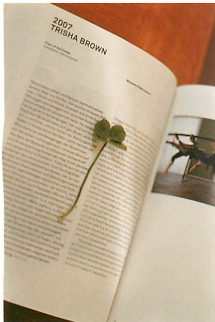
長島有里枝《無題2》(SWISS)より、2007 発色現像方式印刷