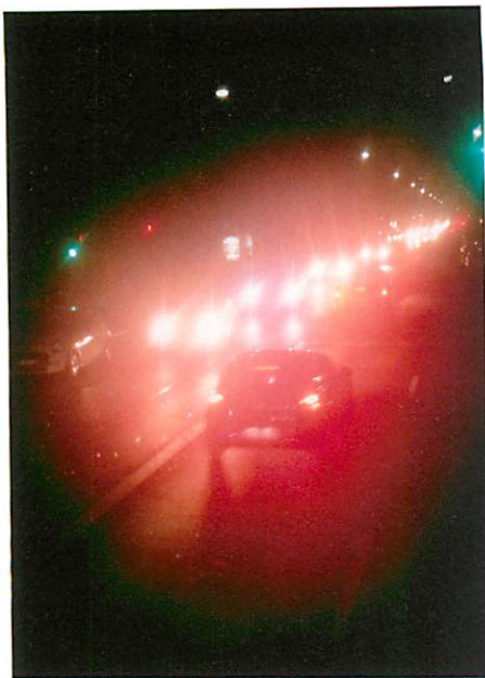
野口里佳《夜の星へ #18》2016 発色現像方式印刷 © Noguchi Rika, Courtesy of Taka Ishii Gallery