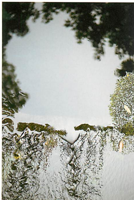
テリ・ワイフェンバック《柿田川湧水》2015 発色現像方式印刷、ビデオ © Terri Weifenbach