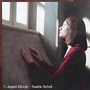
© Jürgen Ciczak / Sophie Scholl