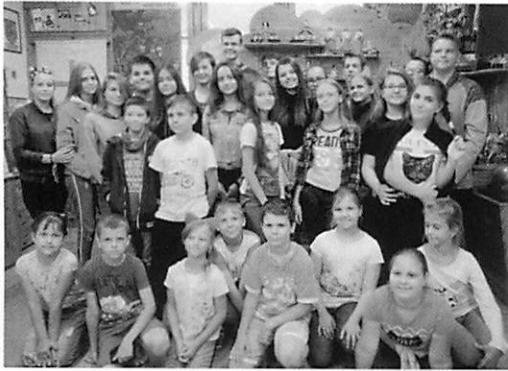
ベラルーシの放射線汚染地区に住む子ども専用の保養施設「希望」で保養をする病気の子どもたち（2018年8月撮影）。チェルノブイリ子ども基金は1996年より甲状腺がんの手術を受けたウクライナとベラルーシの子どものための保養プロジェクトを行っている。現在は脳腫瘍、目の腫瘍、腎臓がんなど、さまざま病気の子どもの保養に招待している。