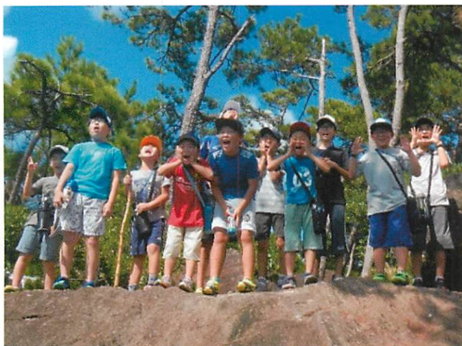
上:「沖縄・球美の里」で保養をする福島の子どもたち (沖縄県・久米島町) 下:「沖縄・球美の里」での甲状腺検診