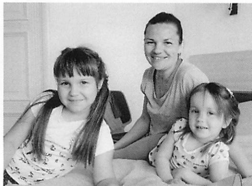
チェルノブイリ事故当時に子どもだった世代は、親となり自分の子どもを持つようになった。チェルノブイリ子ども基金は甲状腺手術を受けた親とその家族の保養プロジェクトも行っている。2018年5月「希望」で行われた保養に参加した親子。