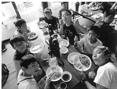
「沖縄・球美の里」2012年7月に沖縄県の久米島に設立した、国内では唯一通年で利用できる福島の子どものための保養施設。毎回約10日間、福島の子どものたちや保護者約50人を受け入れている。豊かな自然に触れ合えるさまざまなプログラムが組まれている。2019年1月まで、子ども3,449人、保護者834人、計4,283人が保養に参加した。