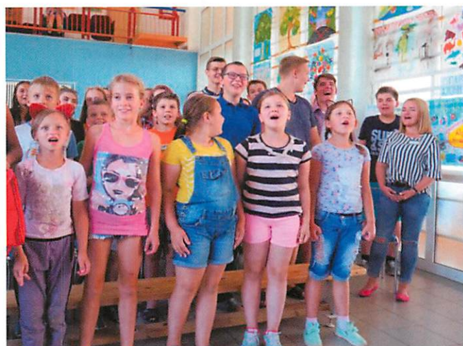
「希望 (ナデジタ)」で保養をするベラルーシの子どもたち (ベラルーシ・ミンスク州)