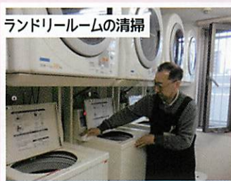
ランドリールームの清掃