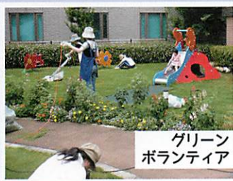
グリーン ボランティア