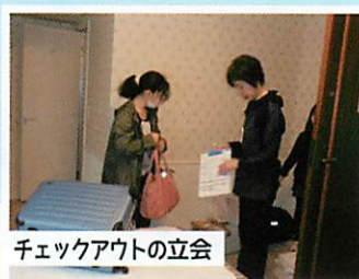
チェックアウトの立会