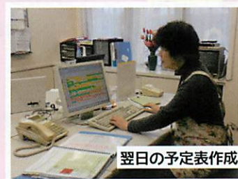
翌日の予定表作成